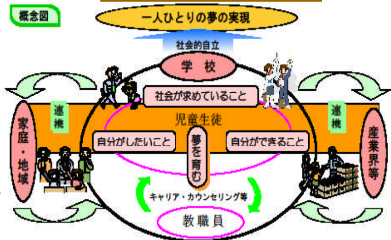
山口県のキャリア教育の概念図と視点